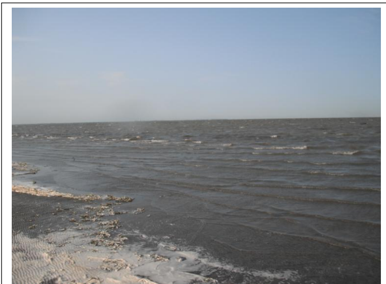
Le Lac Saint-Pierre devient agité

Je fais donc connaissance avec le Club Multivoile 4 Saisons. Un membre du personnel m'aide à transporter mon kayak chargé avec un chariot. Il s'agit d'un modèle de chariot conçu pour mettre à l'eau de petites embarcations à voile.