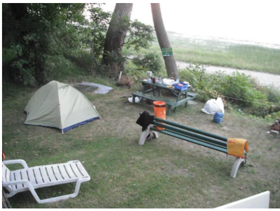
Camping chez Denise à Lanoraie