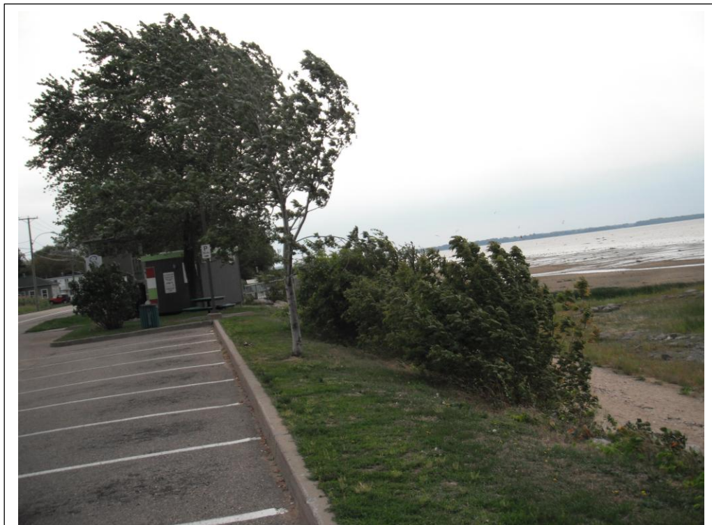
Un vent qui ne laisse aucun répit.

J'entreprends de me rendre au village pour faire des emplettes. Je marche environ quatre kilomètres. J'en profite pour acheter à la pharmacie du baume à lèvres pour soigner mes gerçures. Pour le retour, comme j'ai acheté de la glace, je fais le trajet en taxi.