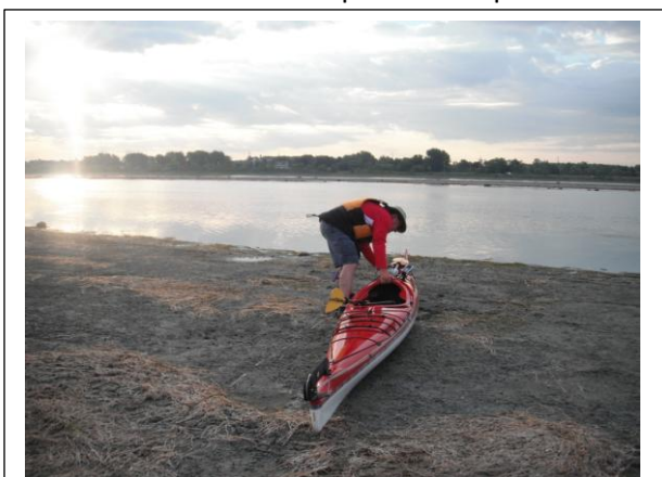
Ouf! Il est chargé.

Nous longeons alors la rivière des Prairies à la recherche d'un endroit pour mettre mon kayak à l'eau. Un kilomètre plus loin, nous trouvons une parcelle de terrain non habité. Ce petit terrain riverain semble servir à laisser passer un boyau qui pompe l'eau de la rivière pour irriguer une terre agricole. Nous choisissons donc cet emplacement pour mettre à l'eau le kayak et le remplir de bagages.