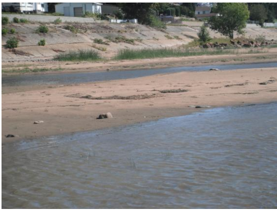
Pause pour dîner au Ruisseau Cormier