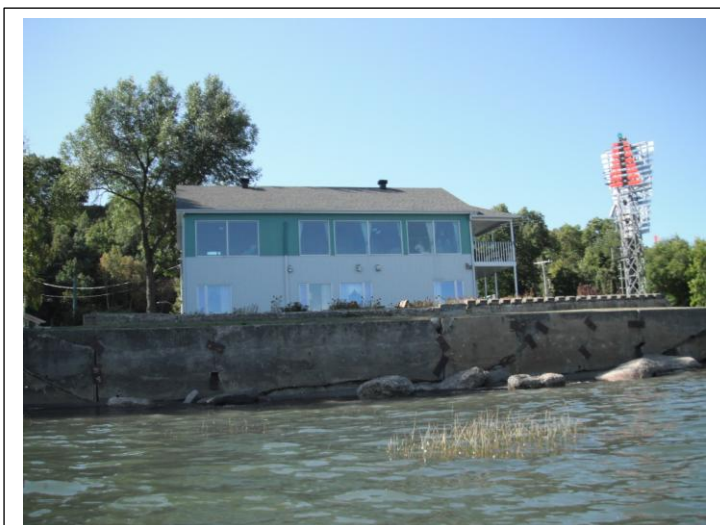
Auberge le Marquis-des-Phares