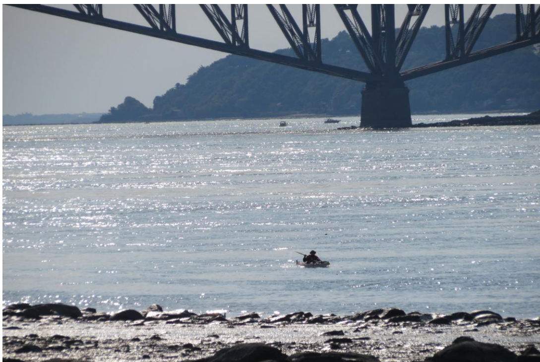
Arrivée à l'anse Benson