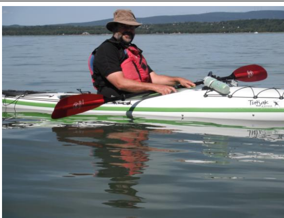
Rencontre d'un kayakiste de Cap-Rouge

Je rencontre à deux reprises des kayakistes solitaires. Je discute avec eux. Un m'explique de ne pas être surpris par un gros remous après avoir traversé le pont de Québec près de la rive sud. Un autre me prend en photo avec le pont Pierre-Laporte en arrière scène.