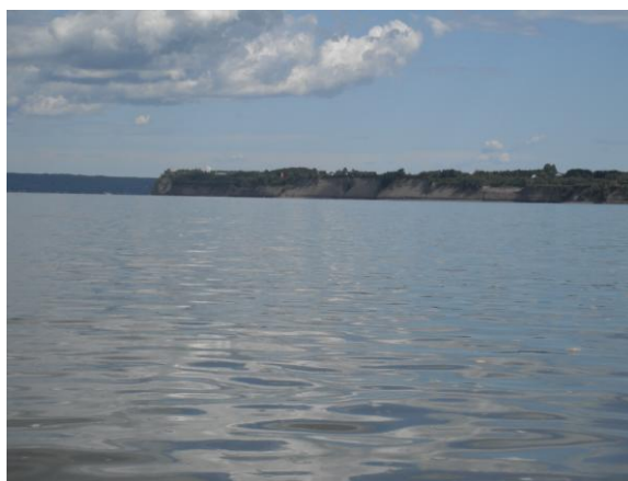
Pointe Platon à l'horizon