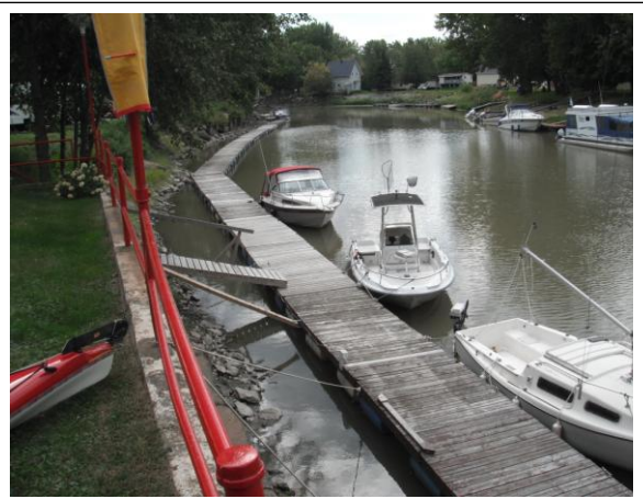
La rivière du Loup