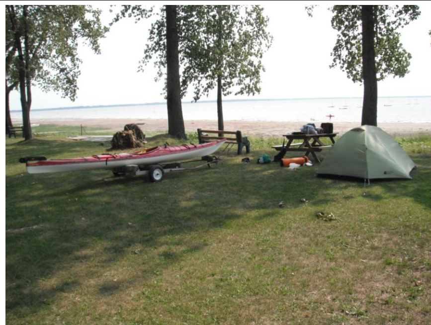
Campement au Centre Multivoile à Pointe-du-Lac

Départ à 7 h, arrivée à 11 h, trajet 21,7 km, arrêt à cause de fortes vagues sur le lac Saint-Pierre. Vitesse moyenne de 6,2 km/h, pointe de 13,6km/h, arrêt 30 minutes.