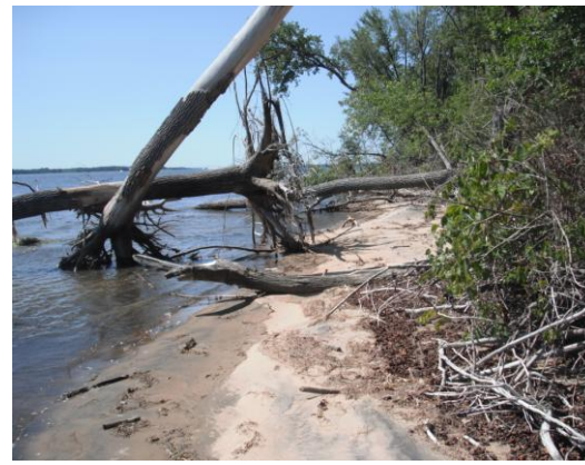
Érosion sur l'île Carignan

Un peu plus loin, je vois l'île Carignan près de Champlain. Cette île est interdite d'accès par mesure de protection de la faune. Tout au long de sa berge, on remarque des plages de sable et plusieurs gros arbres déracinés. Comme la voie maritime est très près du rivage à cet endroit, cette érosion est peut-être due aux vagues des bateaux.