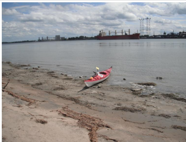
Casser la croûte à Berthier

Je dois donc rebrousser chemin pour contourner l'île de Grâce et entreprendre de longer la voie maritime. Je côtoie donc l'île de Grâce puis l'île Lapierre. Cette dernière est inhabitée. Elle est sauvage et j'aperçois plusieurs sites où il serait tentant de camper.