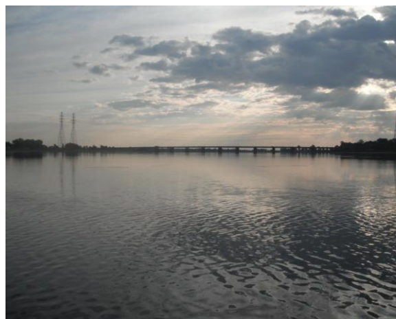
Le pont Charles-De Gaulle

Je suis parti. Je mets le cap sur le pont Charles-De Gaulle, illuminé par le soleil levant. Enfin l'aventure débute et je me sens fébrile. L'eau est calme, et je distingue sur le pont les autos et les camions qui amorcent leur heure de pointe. Je me trouve chanceux d'éviter ces embouteillages.