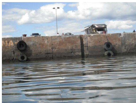
Quai de Portneuf