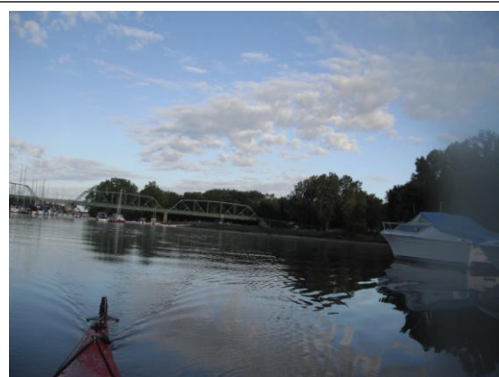
Pont et marina de Batiscan

L'objectif prévu dans mon itinéraire est de coucher au camping de la marina de Batiscan (BAT03). Je dois donc poursuivre encore 2 kilomètres avant d'arriver à l'embouchure de la rivière Batiscan. Mais sur place, je cherche l'embouchure. Je ne vois encore que des joncs et de la forêt. Ce n'est qu'à un moment où j'ai aperçu un mât de voilier qui se déplaçait à travers les arbres que j'ai pu deviner où se trouvait le chenal d'entrée sur la rivière.