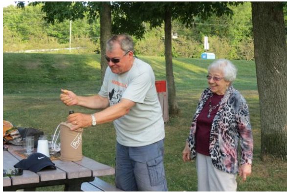
Accueilli par ma mère de 92 ans

Elle nous sert un mousseux. Après ces joyeux échanges, nous allons tous au resto.