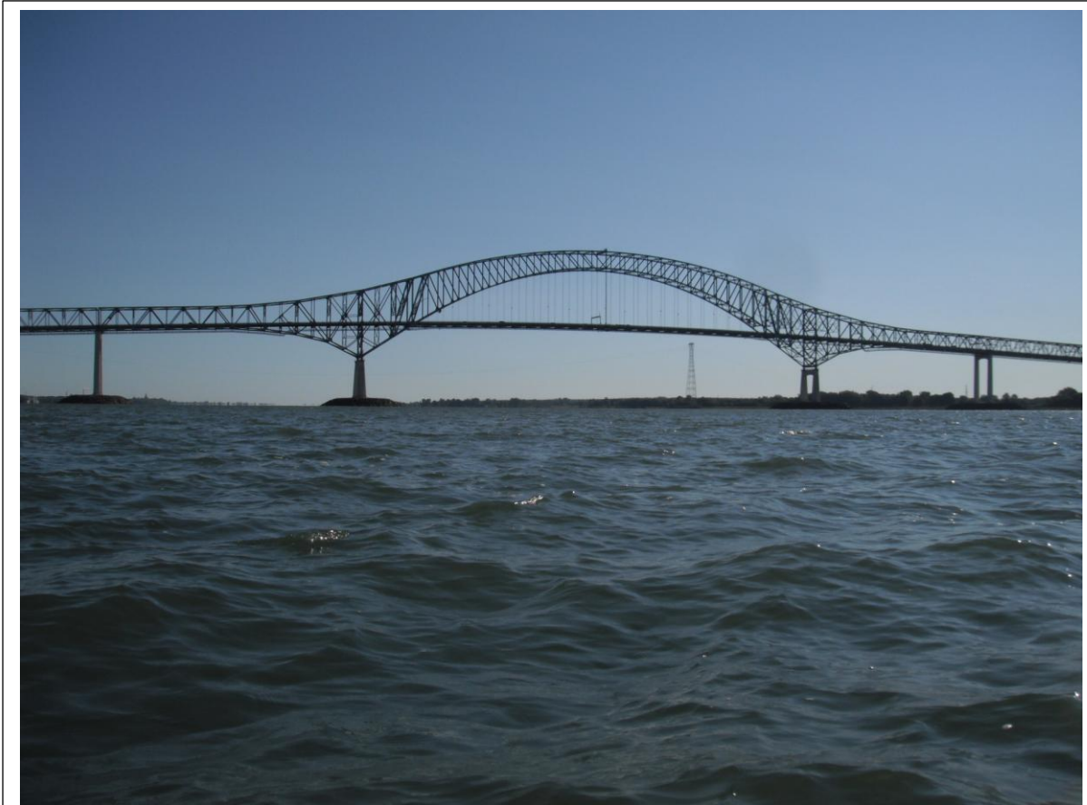
Le Pont Laviolette