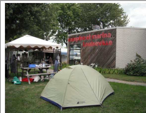
Camping et Marina Louiseville

Le seul endroit disponible pour débarquer étant le quai, j'y amarre mon kayak. Je vais m'inscrire au camping et je décharge le kayak. Je dois me coucher à plat ventre sur le quai pour sortir mes bagages des caissons parce que la distance entre l'eau et la surface du quai est d'environ 70 cm. Je monte ma tente à la noirceur. Je suis épuisé. Je mange une barre tendre, je prends une douche et je me couche sans souper.