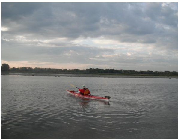
Le grand départ

L'eau de la rivière est très basse et le sol est glaiseux. Je tire, l'embarcation chargée jusqu'à l'eau. Je la trouve lourde, c'est la première fois que je pars avec un kayak si rempli. À 7 h 25, j'embarque dans mon kayak les pieds pleins de boue et c'est le départ.