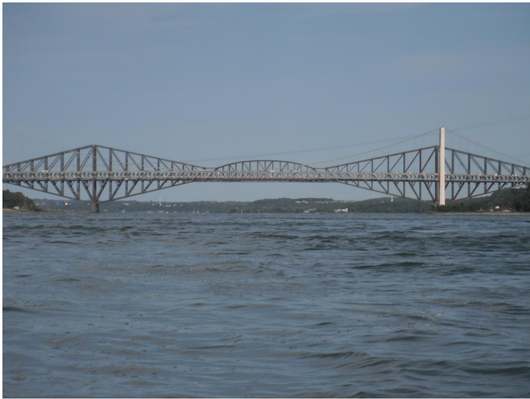
Le pont Pierre-Laporte et le pont de Québec