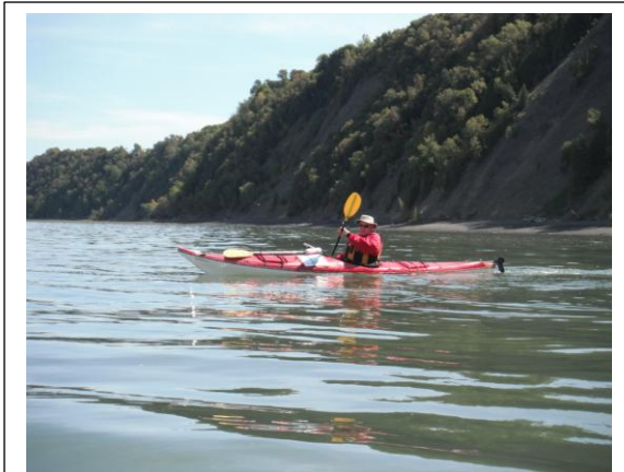
Près des rives escarpées à Saint-Antoine-de-Tilly

Je m'approche des ponts avec comme objectif de les franchir à 16 h. Le rétrécissement du fleuve à cet endroit combiné au courant de marée descendante me fait filer très rapidement. Je franchis les ponts à 16 h. Je traverse les remous en question pour ensuite voir du clapotis occasionné par l'arrivée du débit de la rivière Chaudière.