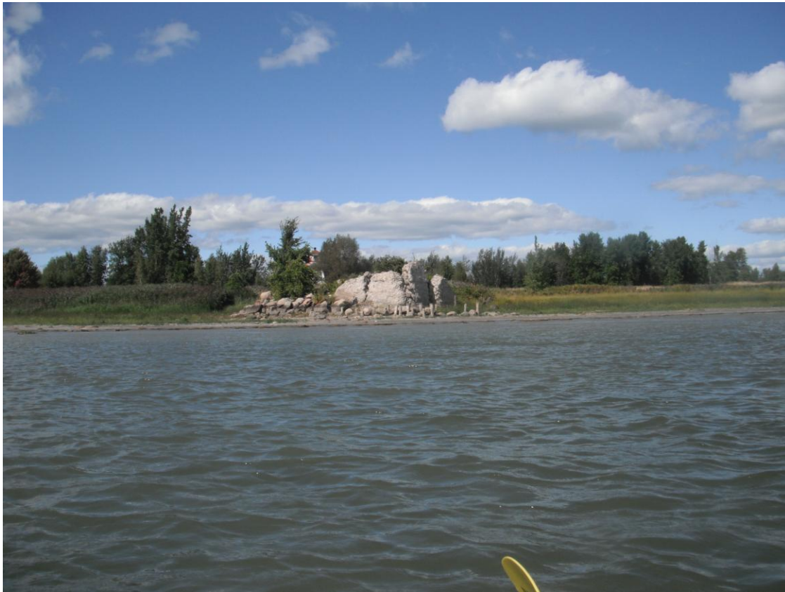
Ruines sur l'île Lapierre

Je me pointe le nez sur le lac Saint-Pierre vers 15 h 30. J'aperçois à la pointe ouest de l'île Lapierre une centaine d'hirondelles de mer, aussi appelées « sterne pierregarin ». Ce sont de magnifiques oiseaux blancs à tête noire. Leurs queues ont un peu la forme de celles des hirondelles. Quelques-unes m'accompagnent sur quelques centaines de mètres en volant au dessus de moi.